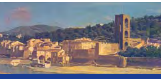
Fig. 3 L. Gelati, L'Arno alle Molina di S. Niccolò , Museo Firenze com'era

L. Gelati, The Arno at the Molina of S. Niccolò, Museum Firenze com'era