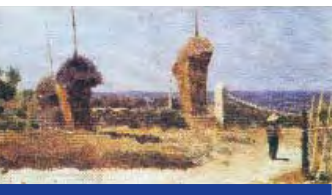
Fig. 2 L. Gelati, Castiglioncello, 1864, Collezione privata

L. Gelati, Castiglioncello, 1864, Private collection